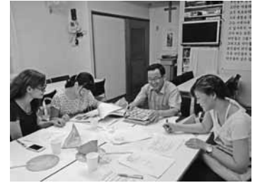
2013学年度 国際ロータリー第2690地区 米山記念奨学生オリエンテーション・歓迎会 平成25年5月12日 於 倉敷国際ホテル