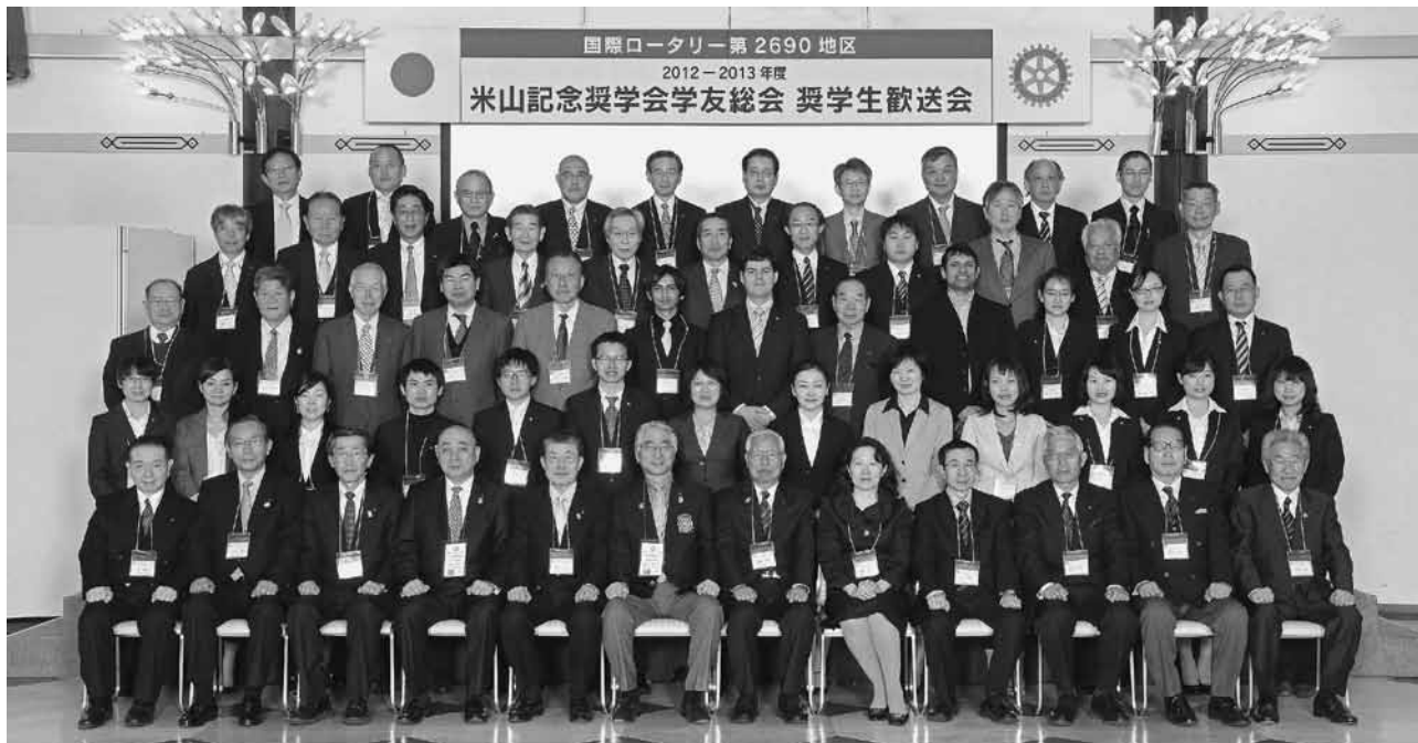
2012-2013年度 国際ロータリー第2690地区 公益財団法人 米山記念奨学会学友総会 奨学生歓送会 2013年3月10日 於 倉敷7化ビルスクエア