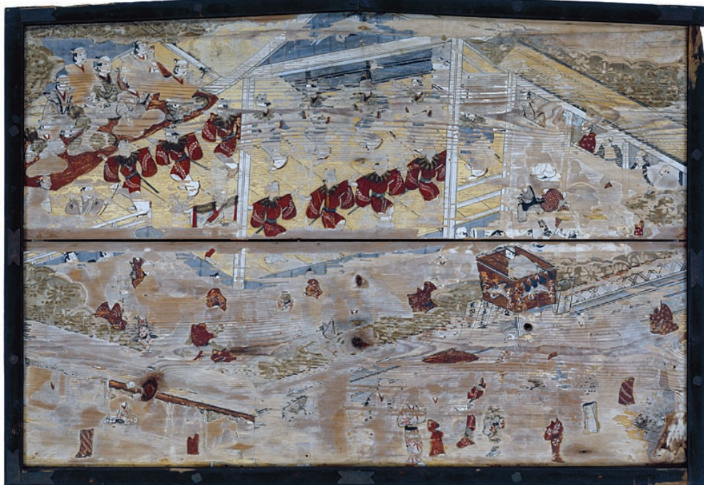
長谷寺絵馬「歌舞伎図(延宝5年)」